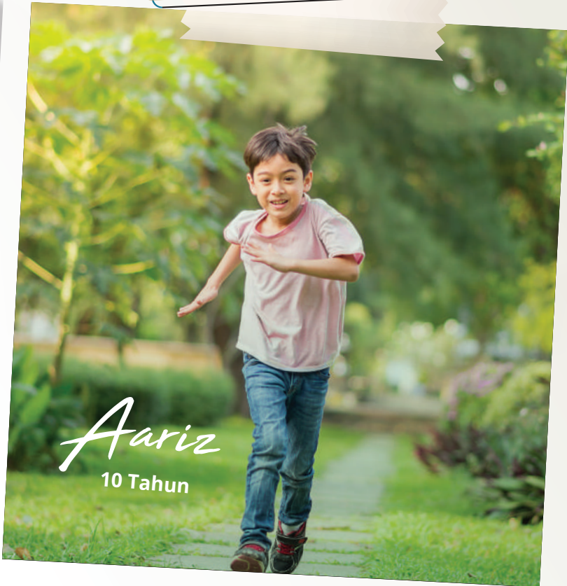
Ariz 10 Tahun